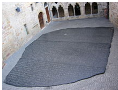
Joseph Kosuth reproduit la pierre de Rosette au musée Champollion de Figeac