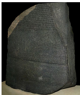
La pierre de Rosette

Faire une recherche sur les écritures .L'aventure des écritures ( bnf.fr/dossier/ )