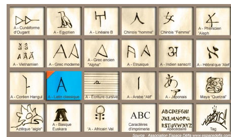
Quelques exemples d alphabets